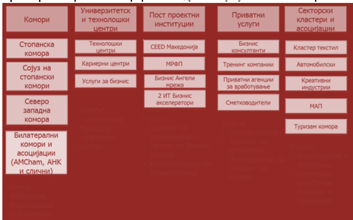
Органограм 3. Приватни и непрофитни снабдувачи на услуги за бизнис-секторот